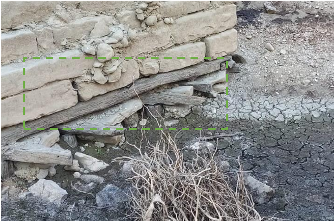
Pjesa e zbuluar e bazamentit prej druri