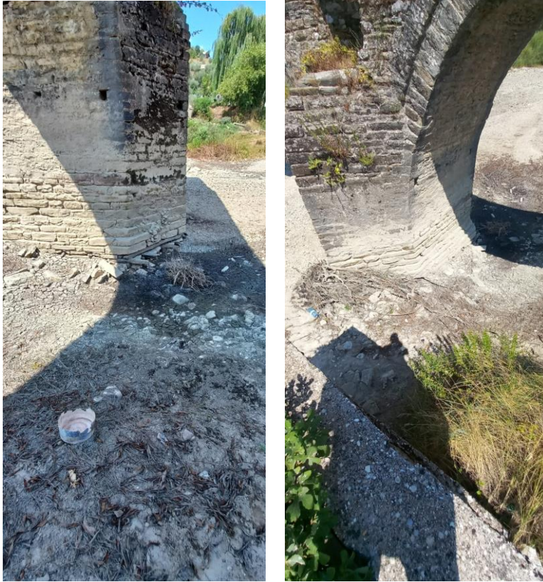
Zbulimi i kembes se trete