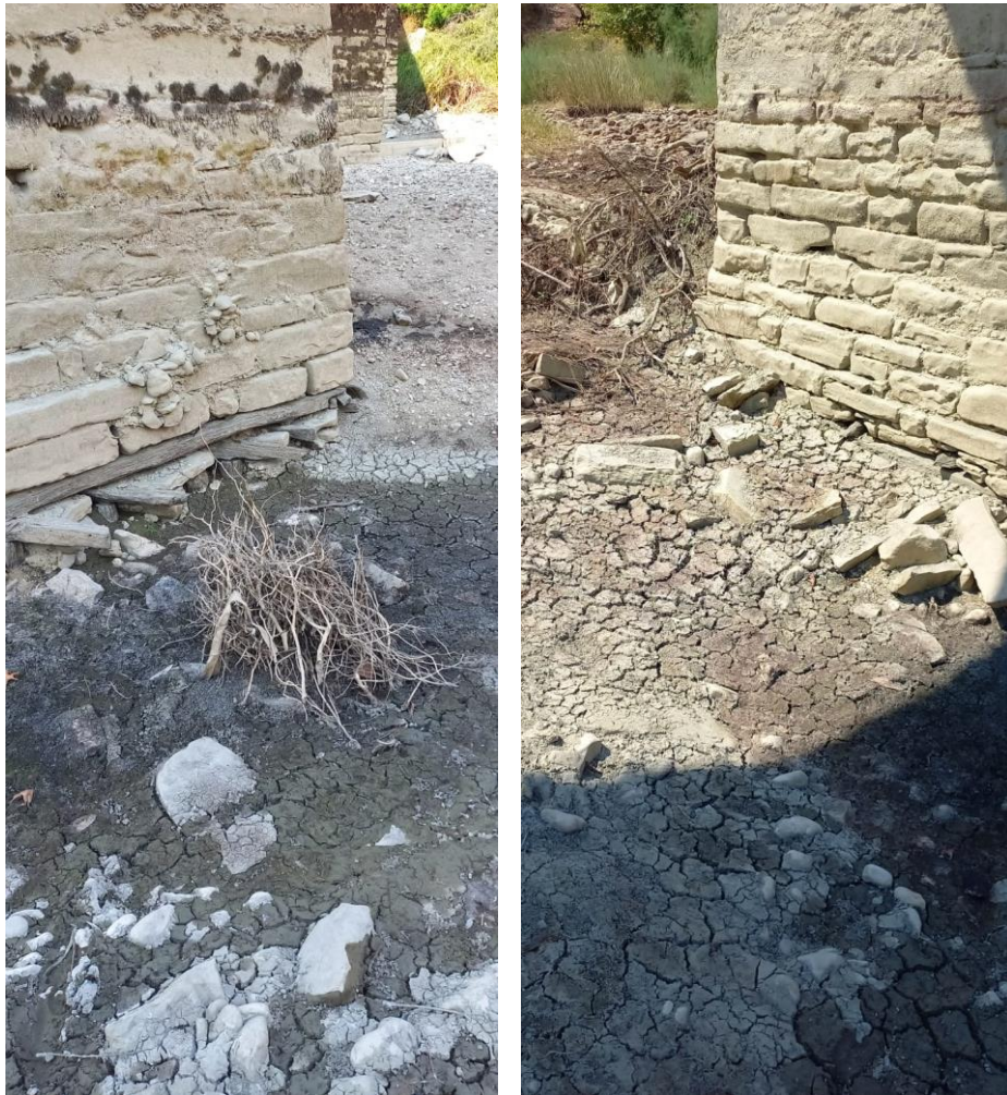
Zbulimi i kembes se trete