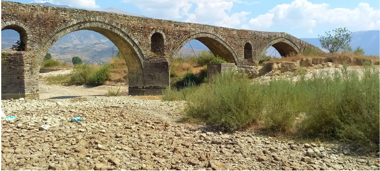
Ura ne gjendjen e sotme