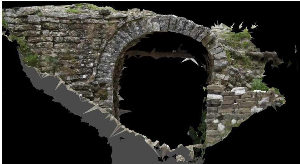
Fig. 6- Deformimi i qemerit, bjeri i sipërm dhe tubacioni i vjetër i ujësjellësit