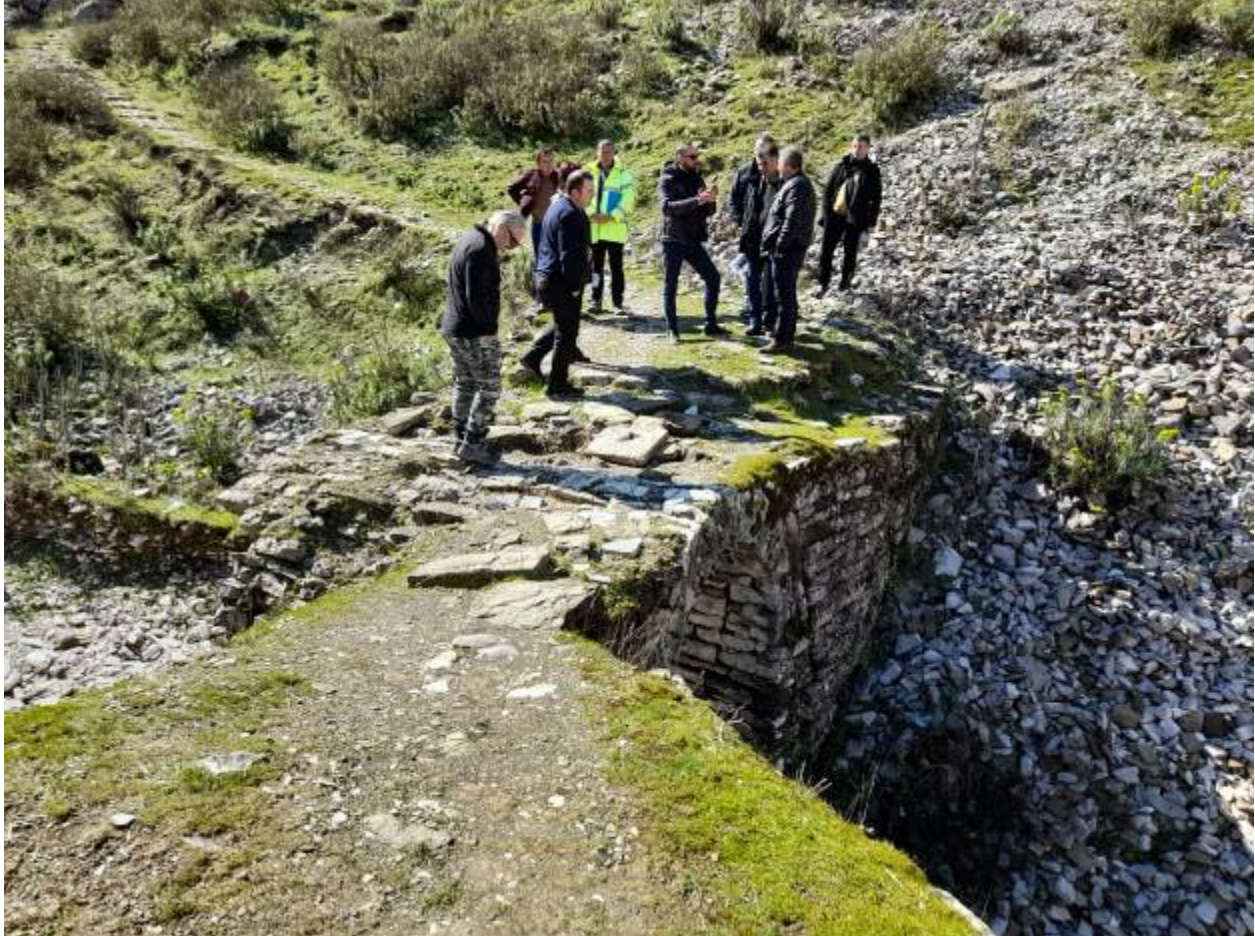
Fig. 5- kalldrëmi i urës, hyrja nga ana e kalasë