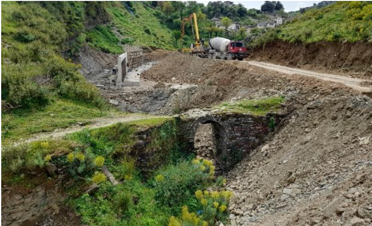
Fig. 2- Pamje e bjefit të poshtëm

Ura me qemer gjysmë rrethi janë urat më të përhapura dhe hasen jo vetëm gjatë rrugëve të rëndësishme të krahinës por edhe në fshatra dhe zona të izoluarra nëpër rrugë sekondare apo rrugë të brendshme në vendbanimet e asaj kohe. Gurët janë me dimensione relativisht të vogla dhe janë të vendosura në formë radhorë.