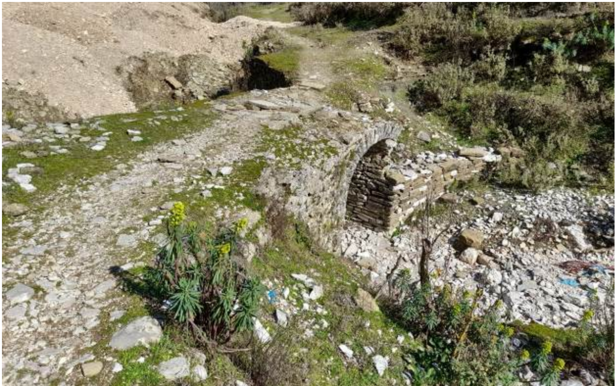
Fig. 4- Pamje e bjeftit të sipërm