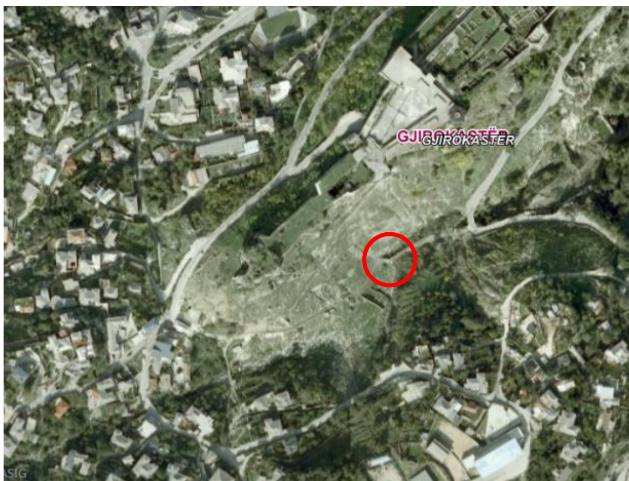
Fig. 1 Vendndodhja e urë në lidhje me kalanë e Gjirokastrës

Ura e Mesit është një nga tre urat e ngritura përgjatë përroit të Zerzebilit, në krahun jugor të kalasë së Gjirokastrës, dhe përkatësisht më koordinata gjeografike, 40^{\circ} 4'18.31''N dhe 20^{\circ} 8'21.95''E . Ura e mesit ka status pasuri kulturore kategoria e I, shpallur me urdhëresë të Ministrisë së Arsimit dhe Kulturës, datë 08.01.1977.