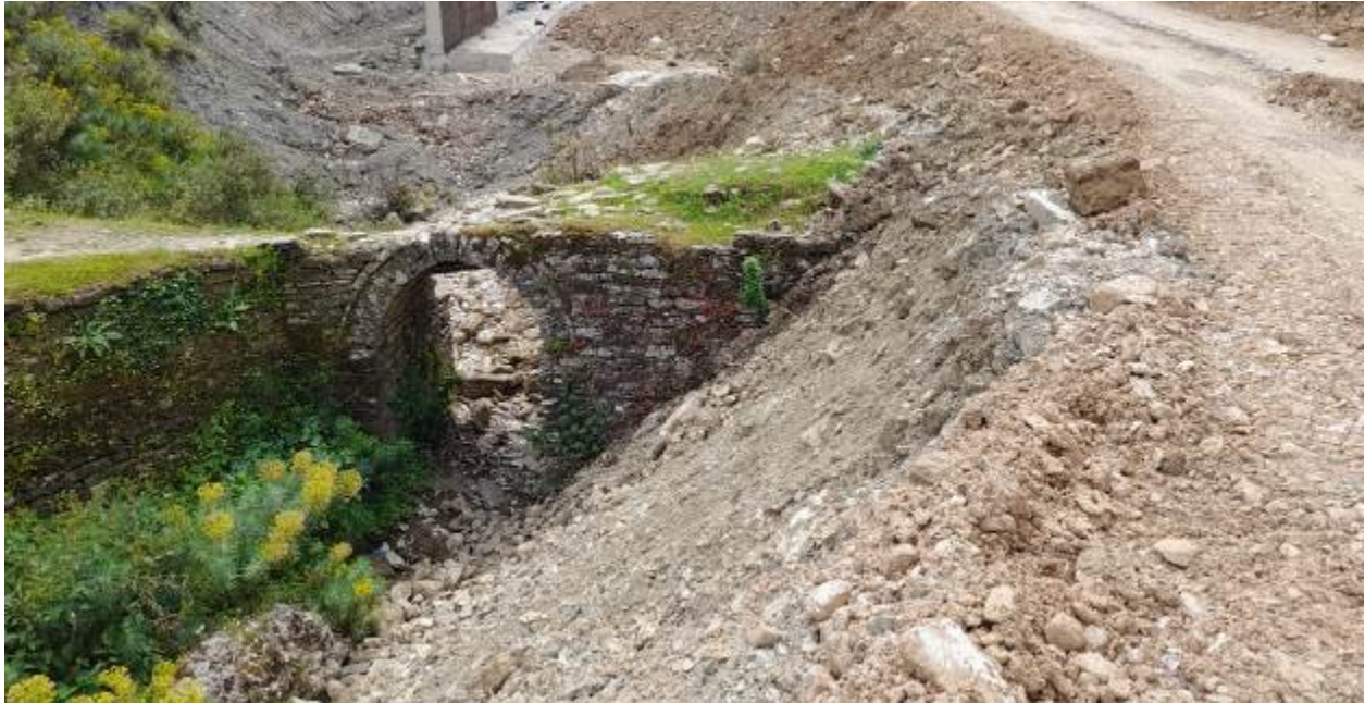
Fig. 3- Pamje e bjeftit të poshtëm